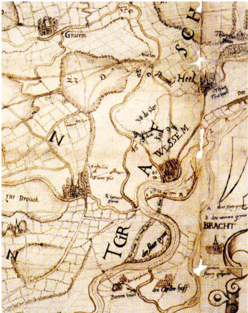
Wessem en omgeving. Minuut (?) van een primitieve chorografische kaart, toegeschreven aan Jacob van Deventer, ca. 1550. Rijksarchief in Limburg, Maastricht.