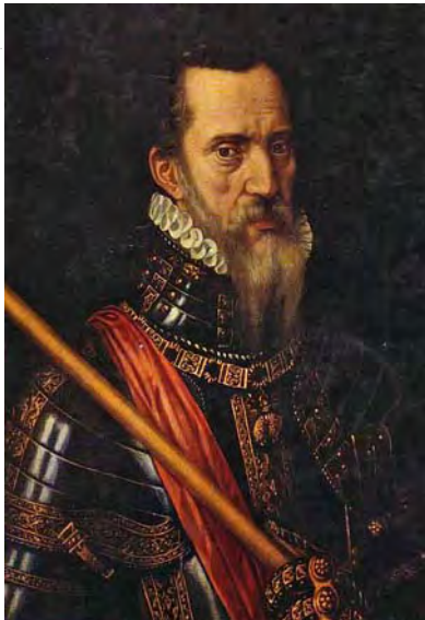
Ferdinand Alvarez de Toledo, hertog van Alva. Portret, geschilderd door Willem Key, in 1568, toen de hertog net in de Nederlanden was gearriveerd.