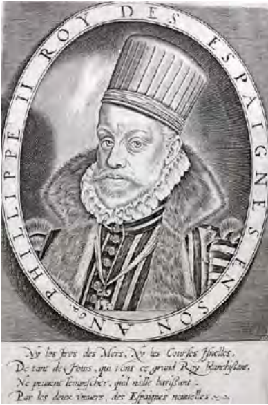
Portret van Filips II, koning van Spanje en landsheer der Nederlanden. Atlas van Stolk, Rotterdam.