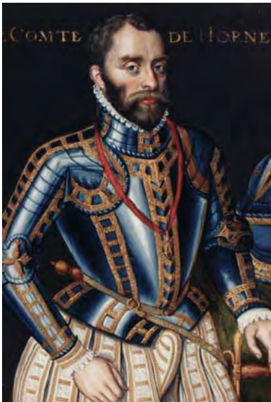
Portret van Filips van Montmorency. Een kopie naar Antonio Moro van Dashorst. Rijksmuseum, Amsterdam.