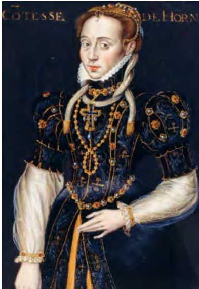
Portret van Walburgis van Nieuwenaar, echtgenote van Filips van Montmorency. Nationale Bibliotheek, Wenen.